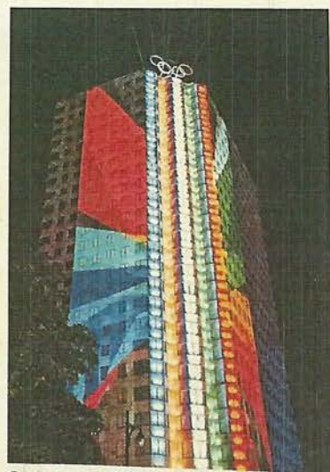
Cet immeuble au centre-ville s'illumine tous les soirs depuis la cérémonie du 9 juillet.

Pendant que la firme Ombrages réalisait les plans et devis, il a fallu commander le matériel et rapatrier les anneaux olympiques de Lausanne. Une société partenaire de la firme à Vancouver a aussi réalisé un spectacle de lumières multicolores dynamique. Le tout a été complété quatre jours avant la cérémonie. «Un projet de la sorte prend habituellement six mois», remarque M. Laieb qui était l'un des quatre concepteurs du projet. (J.-F.F.)