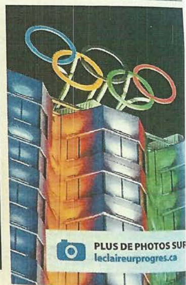
Les anneaux olympiques ont été rapatriés de Lausanne.